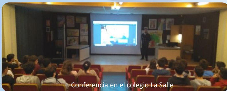
Conferencia en el colegio La Salle