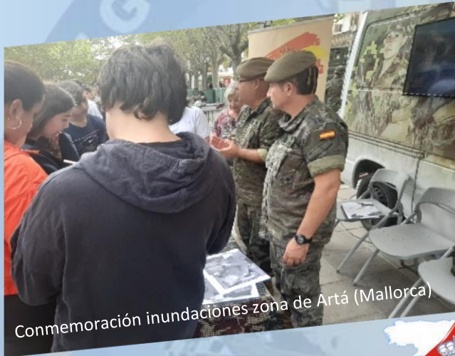
Commemoración inundaciones zona de Artá (Mallorca)