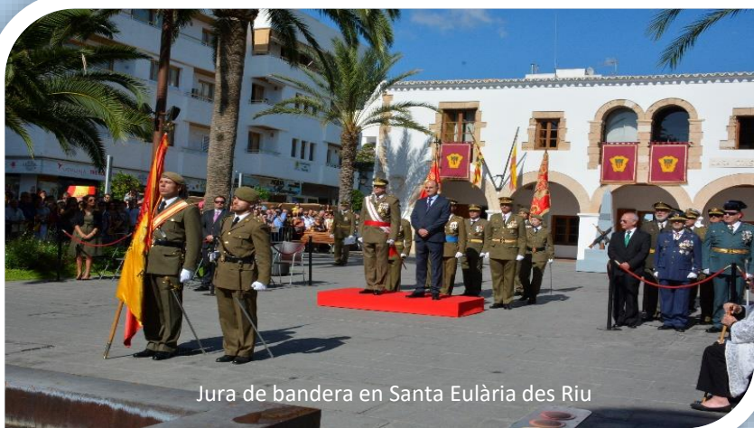
Jura de bandera en Santa Eulària des Riu

Con la publicación del Real Decreto del 2007, se produce una reforma de la estructura de la Delegación. El Servicio de Personal pasa a denominarse Área de Personal y apoyo social , integrándose como área funcional de la Subdelegación de Defensa en Palma. Entre los cometidos que se le asignan a la nueva área se encuentran: