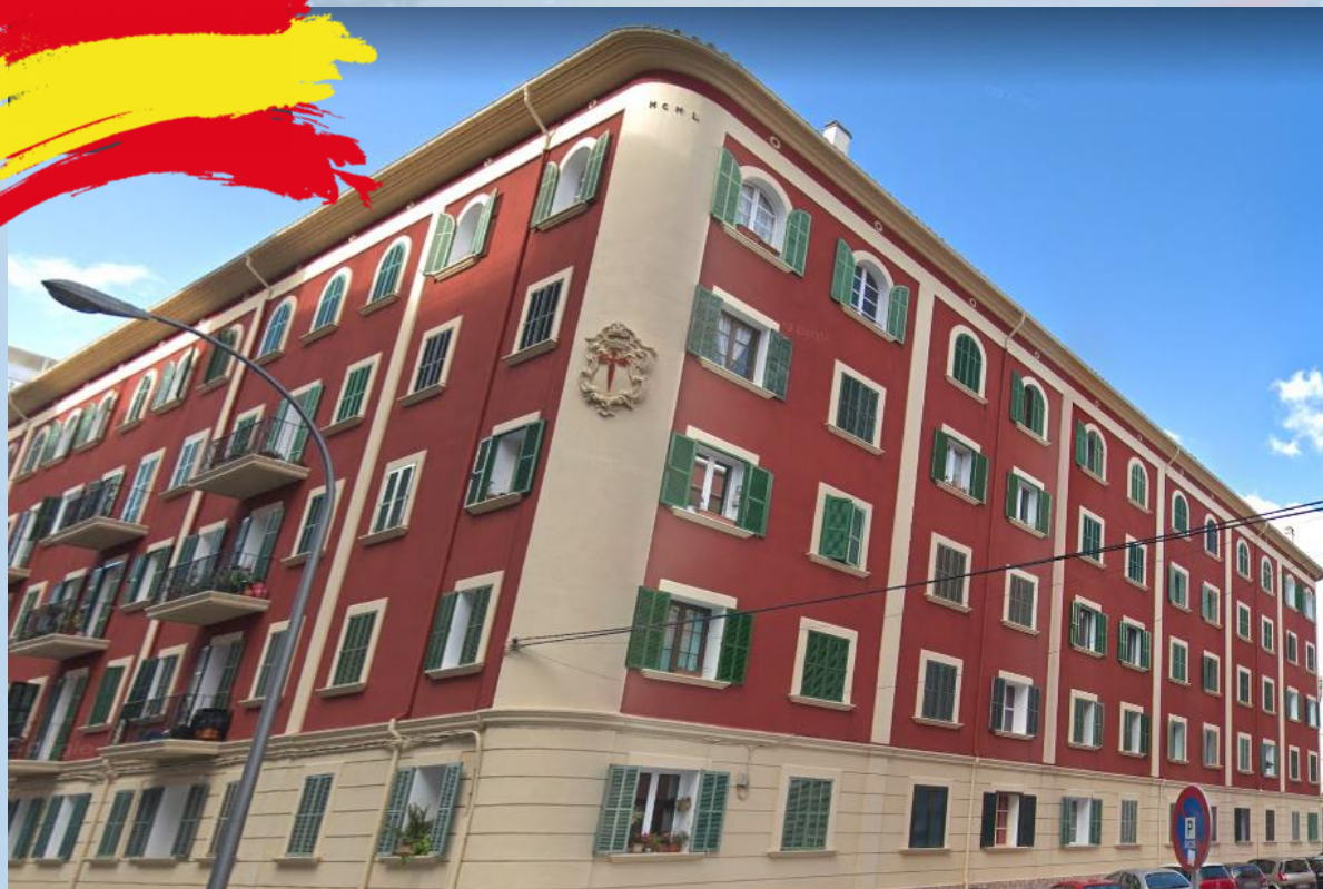
Edificio de antiguas viviendas militares en Palma