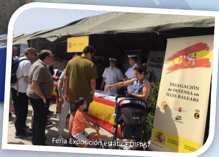
Feria Exposición estática DIFAS