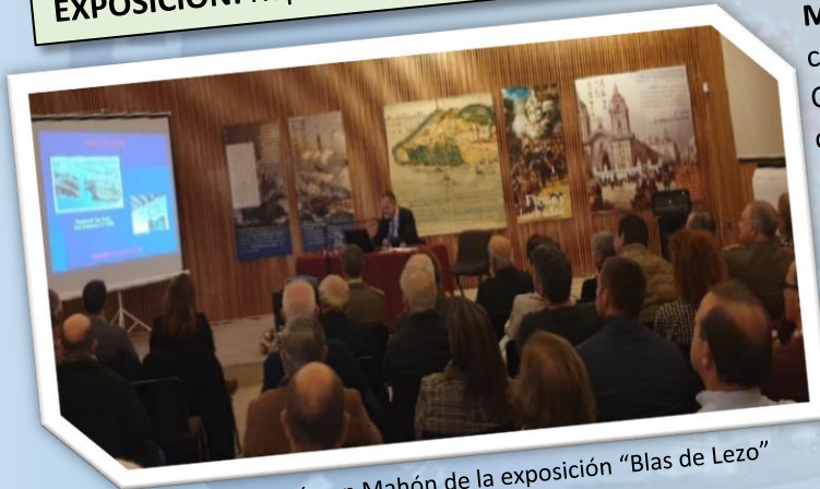
Inauguración en Mahón de la exposición “Blas de Lezo”

CONFERENCIA: Hazaña en la defensa de Cartagena de Indias en 1741, derrotando con 3000 hombres y 6 barcos a 34000 soldados ingleses con 186 buques. EXPOSICIÓN: Repaso detalle de la vida y hazañas de Blas de Lezo.