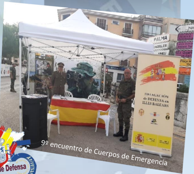
9º encuentro de Cuerpos de Emergencia