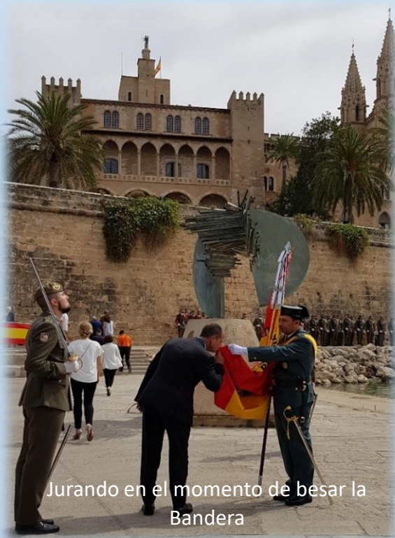
Jurando en el momento de besar la Bandera