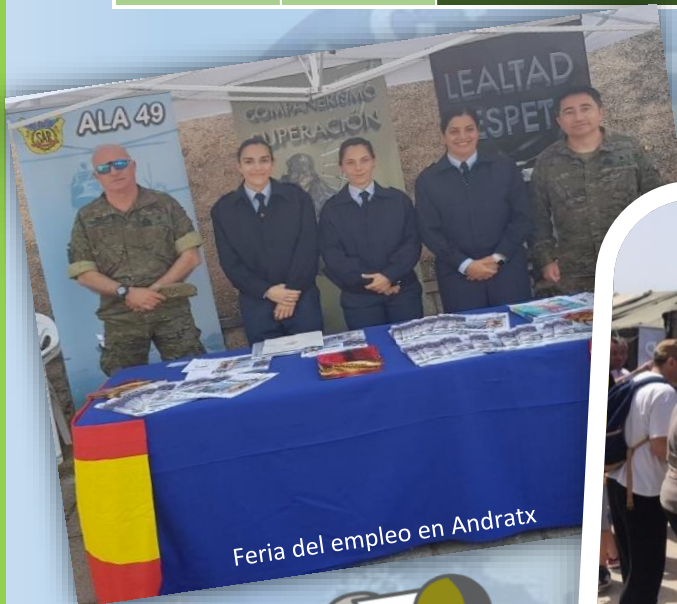
Feria del empleo en Andratx