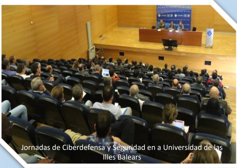
Jornadas de Ciberdefensa y Seguridad en a Universidad de las Illes Balears